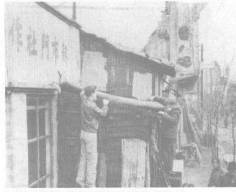
上海解放初期居民开展家庭防火工作历史照片