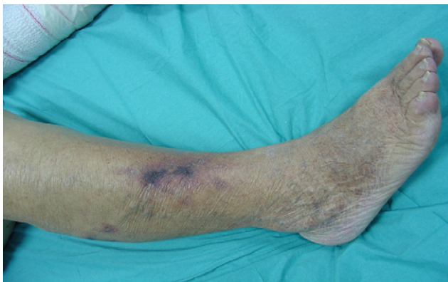
Figura 4. Calcifilaxis (fecha: 4/12/2008).