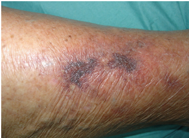
Figura 3. Calcifilaxis (fecha: 30/11/2008).