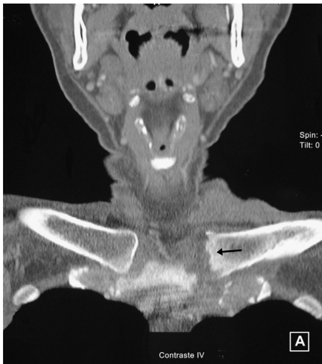
Figura 2. Tomografía computarizada de las articulaciones esternoclaviculares en el caso 2. La izquierda presenta erosiones en su superficie articular (flecha).

El hemograma demostró leucocitosis ( 15,8 \times 10^9/l ; 87% neutrófilos), y trombocitosis ( 479 \times 10^9/l ). Había una marcada elevación de la VSG (79 mm/1. a h) y de la PCR (84,7 mg/l). Los siguientes parámetros bioquímicos fueron normales o negativos: glucosa, urea, creatinina, ácido úrico, GOT-ASAT, GPT-ALAT, GGT, FA, Bi, colesterol total, triglicéridos, CPK, Ca, P, proteínograma, dosificación de inmunoglobulinas (IgM, IgG, IgA) y de complemento (C3, C4). Las radiografías simples de las rodillas solo mostraban un aumento del volumen y densidad de partes blandas en la derecha, de la que, mediante artrocentesis se obtuvieron 158 cc de aspecto purulento. No se visualizaron microorganismos mediante las tinciones de Gram, Ziehl-Neelsen y auramina-