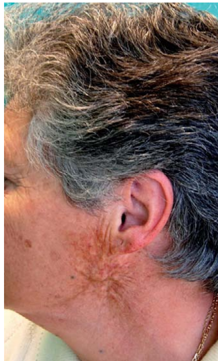
Figura 1 – Área de radiodermatitis en la cola de parótida izquierda.

El análisis hematológico y bioquímico de rutina, así como los resultados de radiología simple, fueron rigurosamente