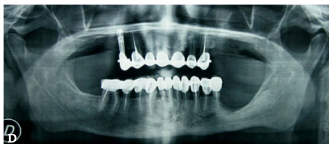
Figura 1 – A) Visión intraoral de la osteonecrosis del maxilar relacionada con bifosfonatos (OMRB) del paciente número 1. B) Radiografía panorámica inicial del mismo paciente. C) El paciente muestra curación de la mucosa al final del seguimiento. D) Radiografía panorámica del paciente número 1 al final del seguimiento.