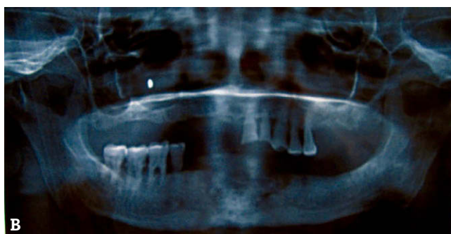
Figura 2 – A) Exposición ósea del paciente número 6 en el momento inicial. B) Radiografía panorámica al final del seguimiento, con persistencia de la osteonecrosis del maxilar relacionada con bifosfonatos (OMRB).

con BF orales después de consumir el alendronato (Fosamax®) en forma ininterrumpida durante más de 10 años.