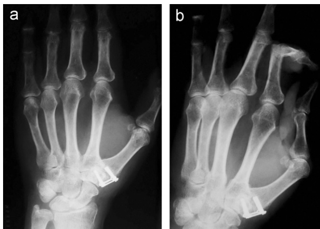
Figura 3 Radiografía anteroposterior (a) y oblicua (b) de artrodesis trapeciometacarpiana sintetizada con placa cuadrangular.

ningún paciente muy insatisfecho. Todos los pacientes menos uno volvería a operarse. Este paciente argumenta que los resultados obtenidos no han cumplido sus expectativas previas a la cirugía.