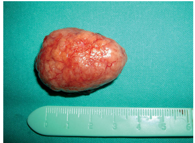
Figura 4 Tumoración una vez extraída. Aspecto macroscópico.

cerebriforme, vascularizada y de coloración amarillo pardusca. La disección se ve facilitada por cápsula bien definida y buenos planos de separación con tejidos circundantes en superficie y profundidad (figs. 3 y 4), cierre con sutura discontinua de Vicryl 4-0.