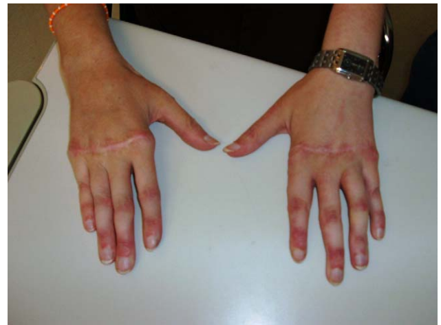
Figura 2. Lupus eritematoso sistémico y artropatía de Jaccoud: corrección quirúrgica.

En casos evolucionados, cuando las deformidades son fijas e irreversibles puede recurrirse a la corrección quirúrgica 68,97 , actuando