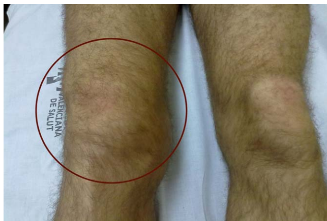
Figura 2 Hemartros de rodilla en un paciente hemofílico.

en peligro su vida 6,7 . En el paciente hemofílico predominan los sangrados musculoesqueléticos, siendo las hemartrosis (fig. 2), los hematomas y las sinovitis las lesiones musculoesqueléticas más comunes 8 . Los sangrados intraarticulares o hemartrosis son la manifestación clínica más frecuente y más conocida de la hemofilia, tanto grave como moderada, representando el 65-80% de todas las hemorragias 9,10 . Las articulaciones afectadas en mayor proporción son las rodillas, los codos y los tobillos, que suponen el 60-80% de todas