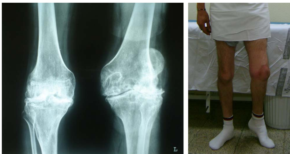
Figura 1 Imagen clínica y radiológica de artropatía hemofílica en un adulto joven.