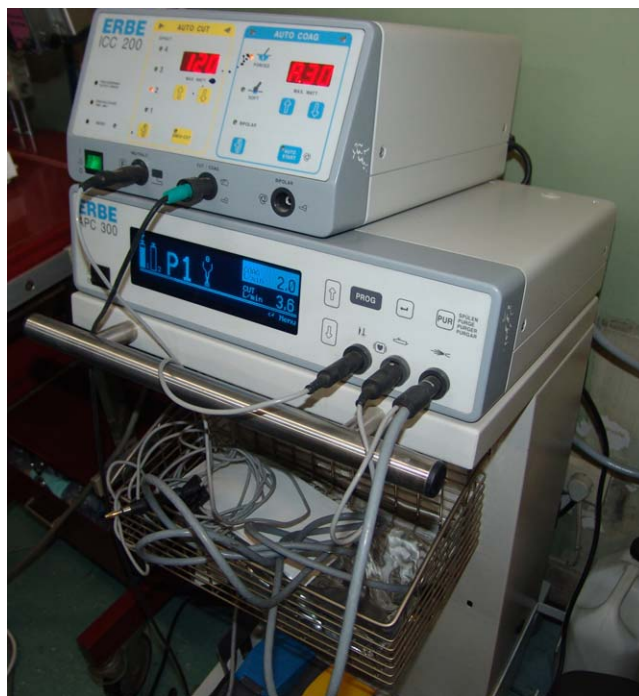
Figura 1. Generador electroquirúrgico ICC 200, ERBE, Alemania.

Se sedó a todos los pacientes con un opiáceo (fentanilo) y/o una benzodiazepina de acción corta (midazolam) por vía intravenosa; también se administró lidocaína mediante inhalación e instilación durante la broncoscopia para la anestesia local. Antes, durante y 3 h después de la broncoscopia se efectuó un electrocardiograma y se monitorizó continuamente la presión arterial y la pulsioximetría. Antes y después de la broncoscopia se efectuó una gasometría en sangre arterial. Los pacientes se sometieron a la broncoscopia en las circunstancias mencionadas previamente. Durante aquella, los pacientes recibieron oxígeno mediante una máscara o una cánula. Tras la identificación del lugar de biopsia se obtuvieron seis muestras biópsicas. Se ha demostrado que la obtención de tres muestras es suficiente para obtener un valor diagnóstico apropiado 7 ; por lo tanto, se obtuvieron aleatoriamente tres biopsias calientes y tres frías en una proporción de 1:1. Para generar los números aleatorios para bloques de seis números, se utilizó un programa informático. Acto seguido, las muestras se introdujeron en contenedores diferentes. Todas las muestras biópsicas se obtuvieron con pinzas de biopsia (FD-7C-1, Olympus Co., Tokio, Japón) con y sin la aplicación de corriente de electrocoagulación (generador electroquirúrgico ICC 200, ERBE, Alemania), ajustado en modo de coagulación suave (40 W) (fig. 1).