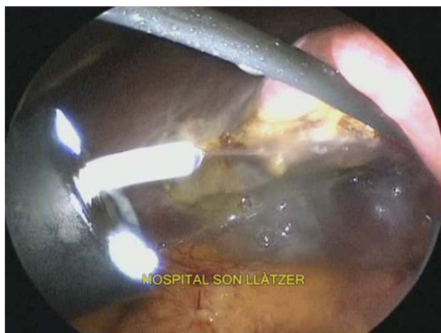
Figura 1 – Visión laparoscópica del endoscopio flexible con salida de la cánula por su canal de trabajo y emisión de fibrina en el lecho de colecistectomía.

varias entradas en el parénquima hepático debidas a una dificultosa liberación posterior de la vesícula con el disector endoscópico. Se decidió la colocación de sellante de fibrina (Tissucol) a través del endoscopio, mediante el empleo de un aplicador de 180 cm (Duplocath 180, de Baxter), que entraba a través del canal de trabajo del endoscopio, y se consiguió con esta medida un correcto control del lecho de resección (fig. 1). La duración total de la operación fue de 60 min. No aparecieron complicaciones postoperatorias y se dio de alta a la paciente a las 24 h.