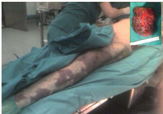
Figura 1 – Joven con síndrome de Klippel-Trenaunay: mancha en vino de Oporto en el hemitórax izquierdo. Imagen macroscópica: bazo que mide 10×14×8 cm y pesa 758 g; externamente es de coloración grisácea con zona azulada, múltiples circunvoluciones y la cápsula no es lisa.

Se describe el caso de un joven diagnosticado de síndrome de Klippel-Trenaunay en seguimiento por cirugía vascular, que presenta angiomas en el miembro inferior y el glúteo izquierdo junto con hipertrofia y varices en el mismo miembro, e intervenido de hemangioma cutáneo en la región inguinal izquierda y de orquiectomía izquierda por hemangioma testicular en la infancia, y que acudió a urgencias remitido desde el centro de salud por dolor lumbar izquierdo, estreñimiento, masa en el hipocondrio izquierdo y hematuria de una semana de evolución (fig. 1).