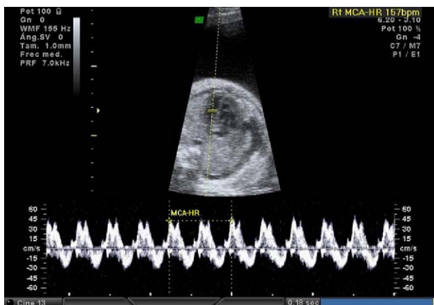
Figura 5 Modo M: frecuencia cardial 157 lpm.

Tras conseguir revertir la arritmia, se realizaron controles ecográficos semanales. En la semana 33+2, había desaparecido el hidrops aunque persistía el polihidramnios, retirándose el tratamiento con digoxina y manteniendo la flecainida.