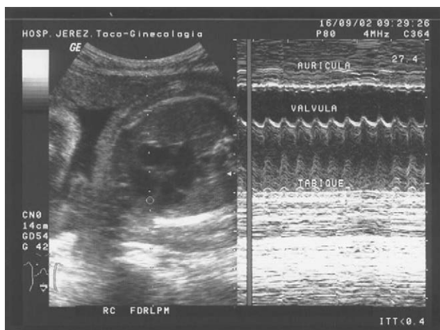
Figura 1 Estudio en modo m: frecuencia cardíaca fetal de 251 lpm.

el periodo prenatal. Aunque las arritmias fetales son en su mayoría benignas, se estima que en un 10–12% de las arritmias se produce un cuadro de hidrops no inmune.