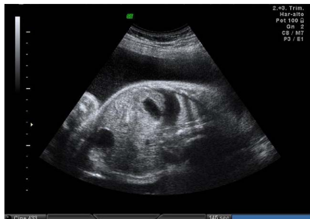
Figura 6 Persistencia de hidrotórax y polihidramnios.

Los controles maternos de digoxinemia y electrocardiogramas seriados fueron normales en todo momento.