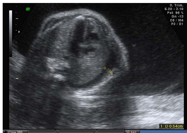
Figura 2 Hidrotórax.

Se decidió tratar a la madre con digoxina mediante una pauta lenta, ya que el feto tenía una buena tolerancia a la taquicardia, sin presentar en ningún momento signos de descompensación cardíaca. Se le administró 0,25 mg/8 h durante 2 días, seguido de 0,25 mg cada 24 h. En el cuarto día de tratamiento el feto disminuyó su frecuencia a 235 lpm. En el décimo día se decidió añadir propanolol 40 mg/6h, disminuyendo la frecuencia a 225 lpm. Los estudios ecográficos seriados, demostraron buen crecimiento fetal sin alteración hemodinámica. Los niveles de digoxinemia, así como los electrocardiogramas realizados para el control materno fueron normales en todo momento.